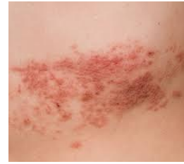
Vết mẩn đỏ trên da do bị giời leo

Bệnh giời leo, còn gọi là herpes zoster, là tình trạng bị mẩn đỏ, phỏng rộp đau đớn trên da do cùng loại vi rút gây bệnh thủy đậu gây ra (vi rút varicella zoster). Theo Trung tâm Kiểm soát và Phòng ngừa Bệnh tật (CDC), gần một phần ba số người dân Hoa Kỳ mắc bệnh giời leo.