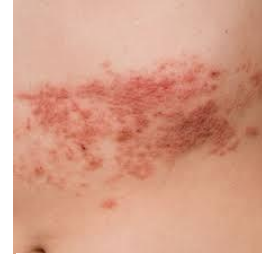
Gratèl po zona koze

Zona, moun konnen tou tankou hèpès zostè, se yon gratèl po ki fè mal menm viris ki lakòz saranpyon an (viris varisèl ak zona) koze. Dapre Sant pou Kontwòl ak Prevansyon Maladi (CDC), prèske youn nan chak twa moun nan Etazini pral devlope zona.