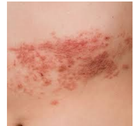
带状疱疹引发的皮疹

带状疱疹是一种疼痛性皮肤病,它是由导致水痘的同种病毒(水痘带状疱疹病毒)引起的。根据疾病控制和预防中心 (CDC) 统计,近三分之一的美国人都将患上带状疱疹。