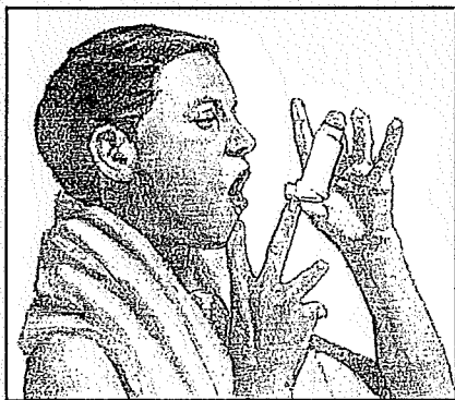
Abra la boca y aleje el inhalador de 1 a 2 pulgadas (3 a 5 cm).